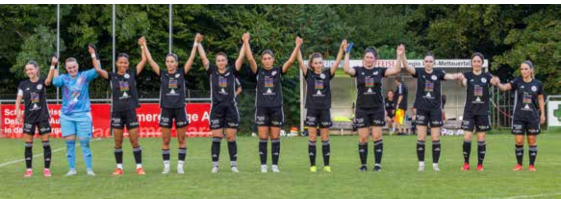
FFT 1 beim Heimspiel auf dem Ebnet

Das FFT 2 startete im Sommer ins Abenteuer 3. Liga. Zu Beginn musste man Lehrgeld zahlen, konnte dann aber die Vorrunde mit 11 Punkten auf dem 8. Rang abschliessen.